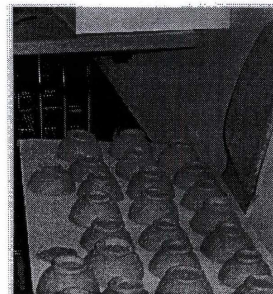
Les poteries que nous avons fabriquées