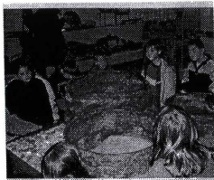
Marmite de la potion magique où Obélix est tombé dedans quand il était petit